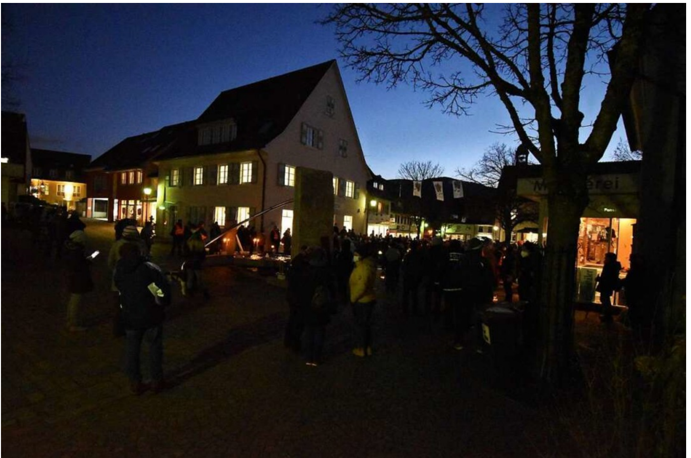
Beim Brunnen in der Kirchzartener Ortsmitte starten die Montags-Demonstrationen der Corona-Maßnahmen-Gegner.

BZ-Plus | Bürgerinnen und Bürger haben die Initiative "Dreisamtal gemeinsam" gegründet. Die Gruppe will den Kirchzartener Montags-Demonstranten entgegentreten. Verschiedene politische Lager sind dabei.